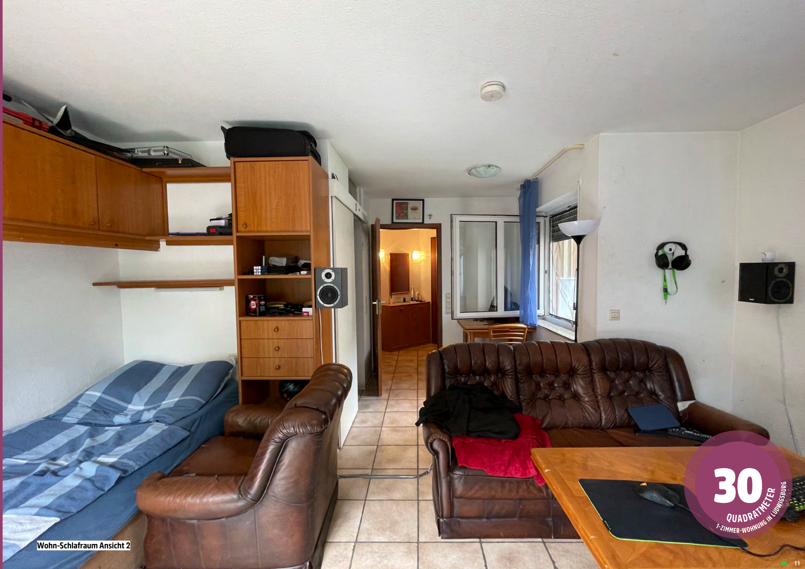
Wohn-Schlafrum Ansicht 2

30 QUADRATMETER 1-ZIMMER-WOHNUNG IN LUDWIGSBURG