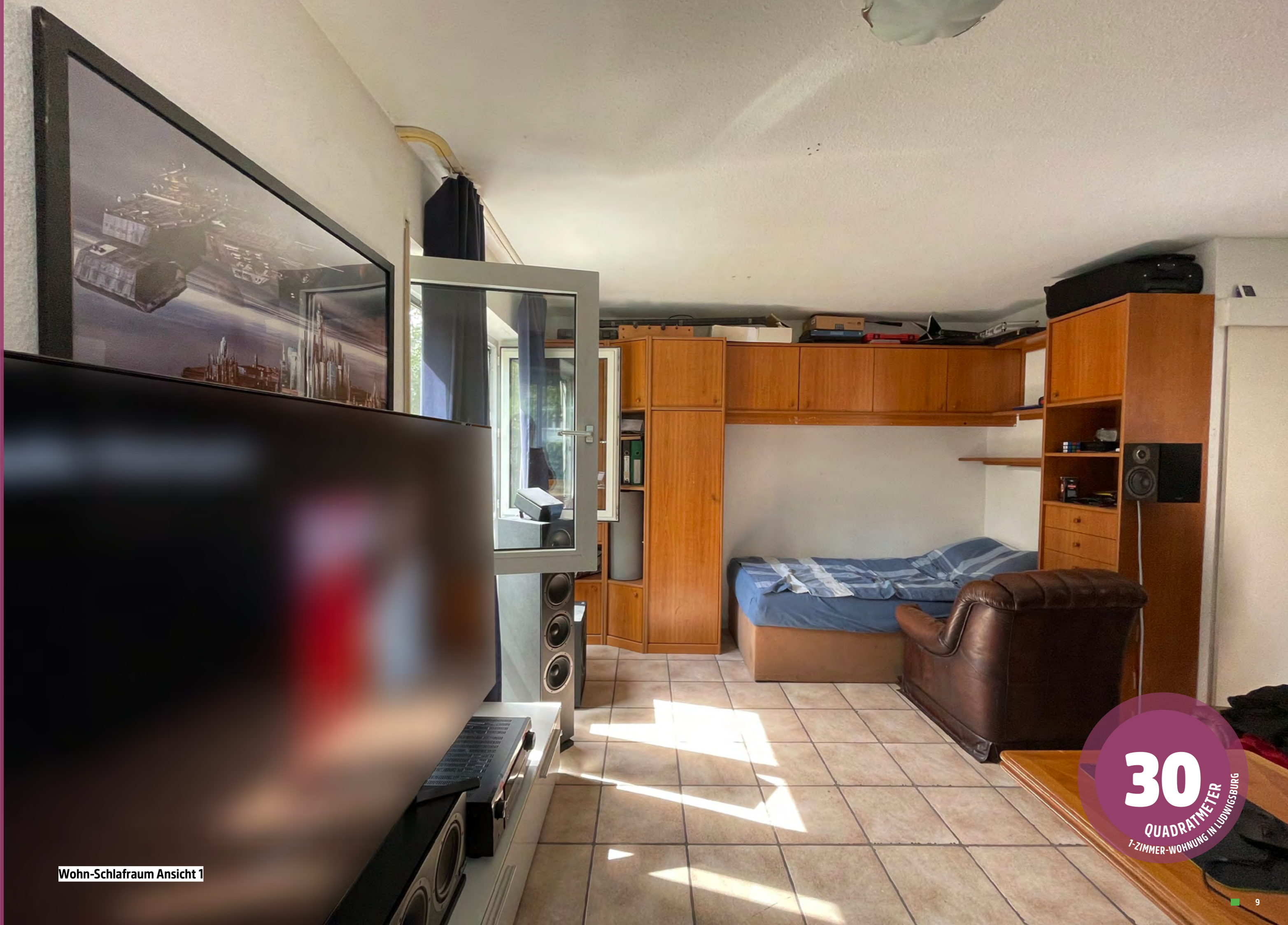
Wohn-Schlafrum Ansicht 1

30 QUADRATMETER 1-ZIMMER-WOHNUMG IN LUDWIGSBURG