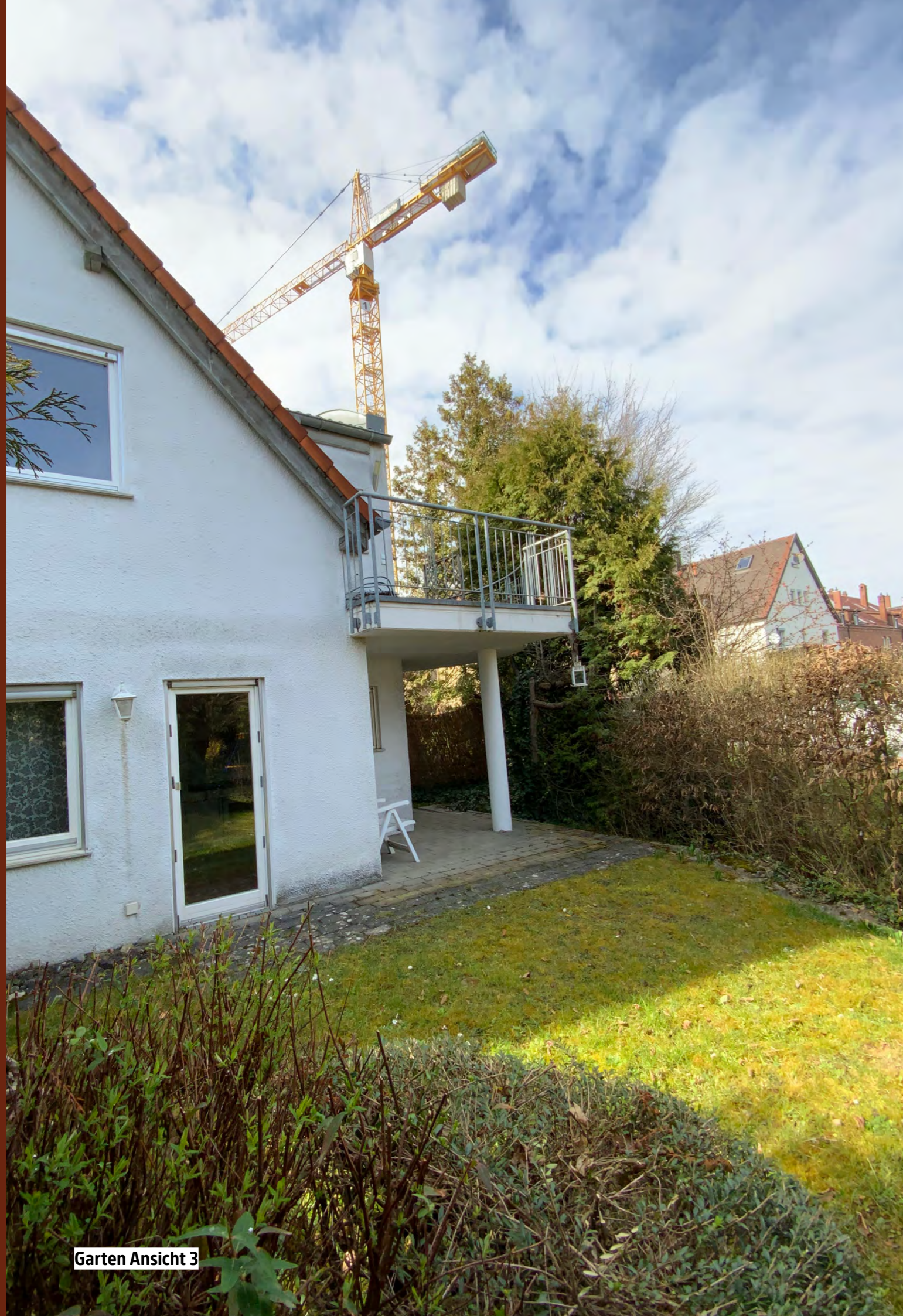
Garten Ansicht 3