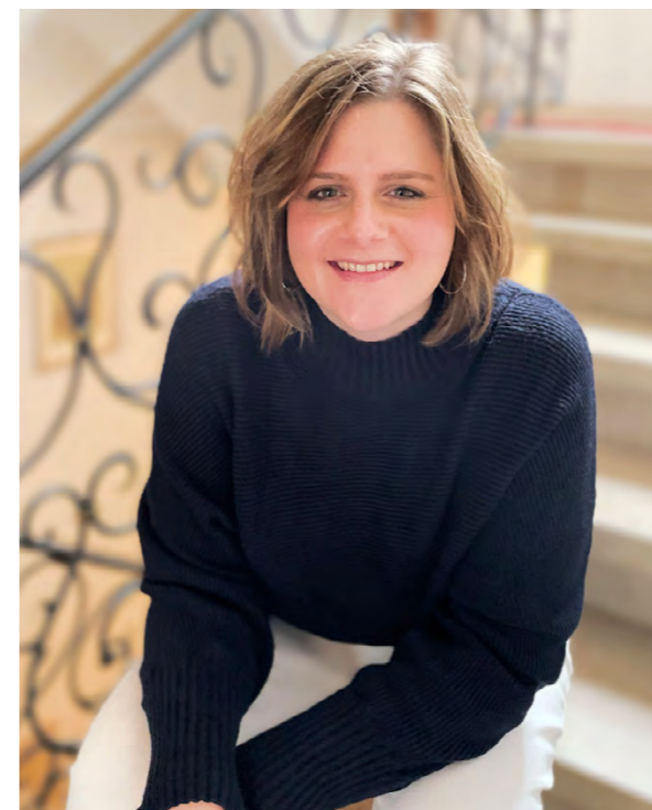
Herzlichst Ihre Sarah Hörster Exposé-Redaktion

Die genaue Zimmeraufteilung finden Sie im detaillierten Grundriss auf Seite 17.