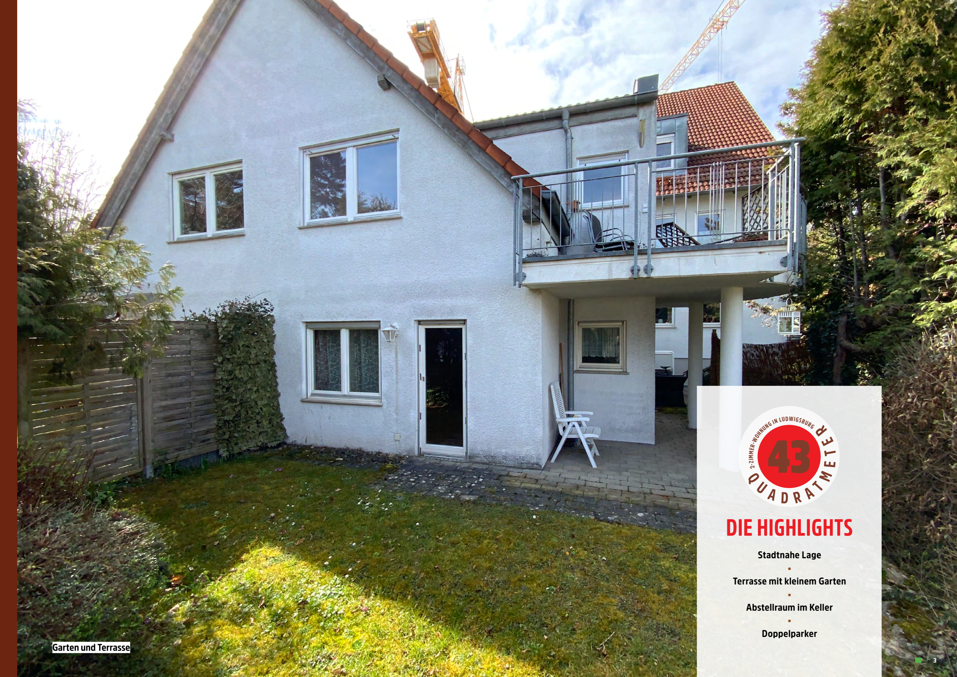
Garten und Terrasse