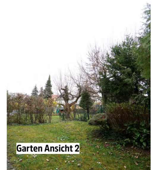
Garten Ansicht 2